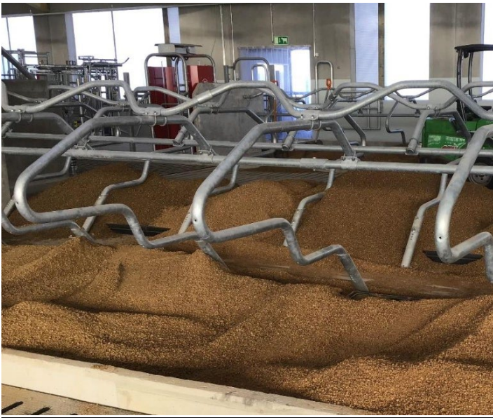
Kuva 5 Syväparsien aloitus olkikuivikerouheella Kpedun navetassa Kannuksessa