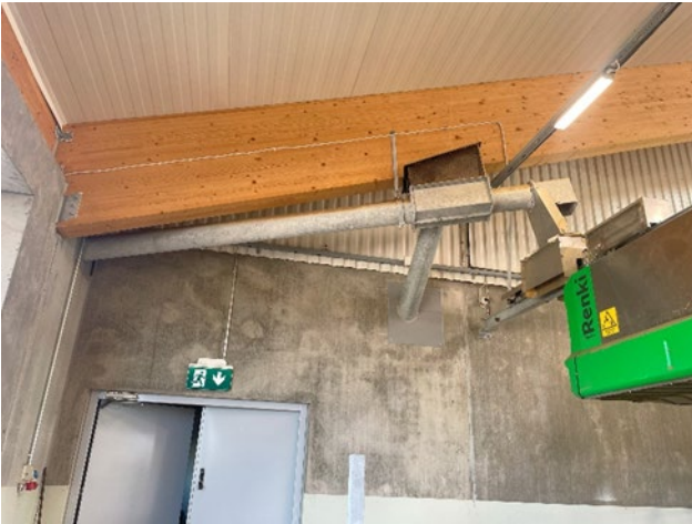
Kuva 2 Separattorilta tuleva kuljetin tuo kuivajakeita kiskokuivittimelle, mutta kuljettimen suuntaa voidaan kääntää viemään kuivajake ulos navetasta

Separattori on mahdollista sijoittaa myös vanhoihin, saneerattaviin navettoihin, mutta silloin lietteen tasalaatuisuuteen ja sekoittamiseen liittyvään suunnitteluun tulee uhrata aikaa ja ajatusta. Asiantuntijaan tulee olla yhteydessä hyvissä ajoin ennen kuin lopullisia rakennusteknisiä päätöksiä on tehty.