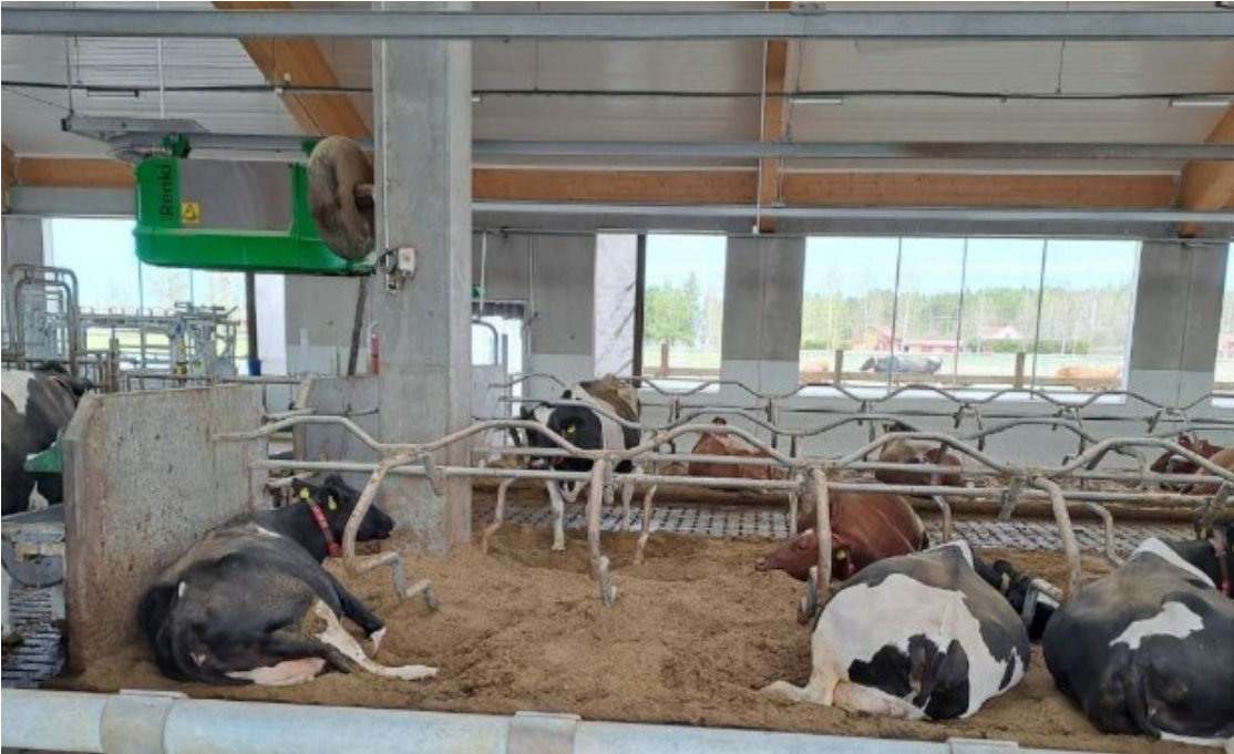
Kuva 1 Lehmiä parsissa